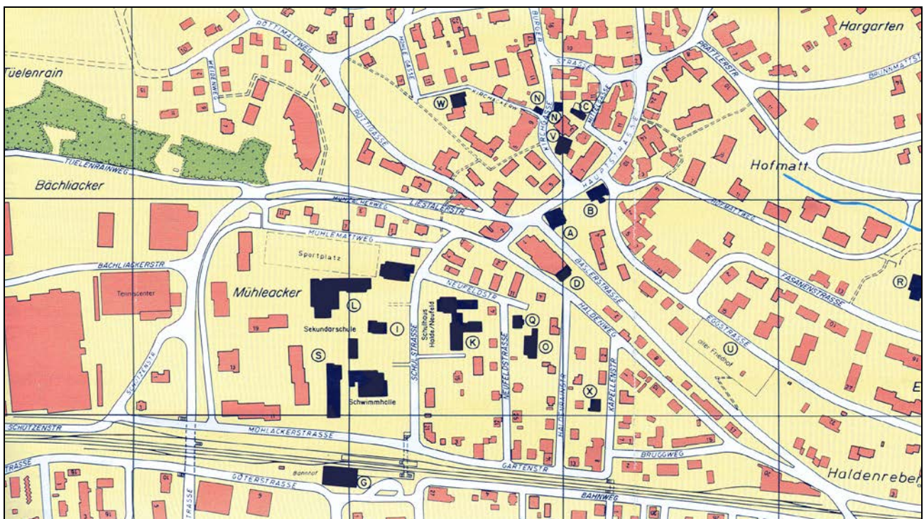
Frenkendorf 1:5000 (2 cm auf der Karte = 100 m in Wirklichkeit)

Üblich für Orts- und Stadtpläne sind die Massstäbe 1:5000 oder 1:10'000.